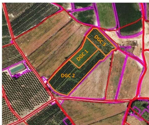
DELIMITACIONS GRÀFiques DE CULTIUS (DGC)