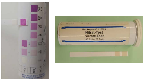
Figura 2. Tires reactives i lectura amb taula colorimètrica.