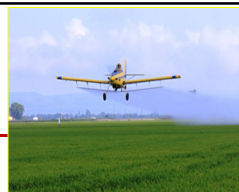
SV-DACC / Generalitat de Catalunya